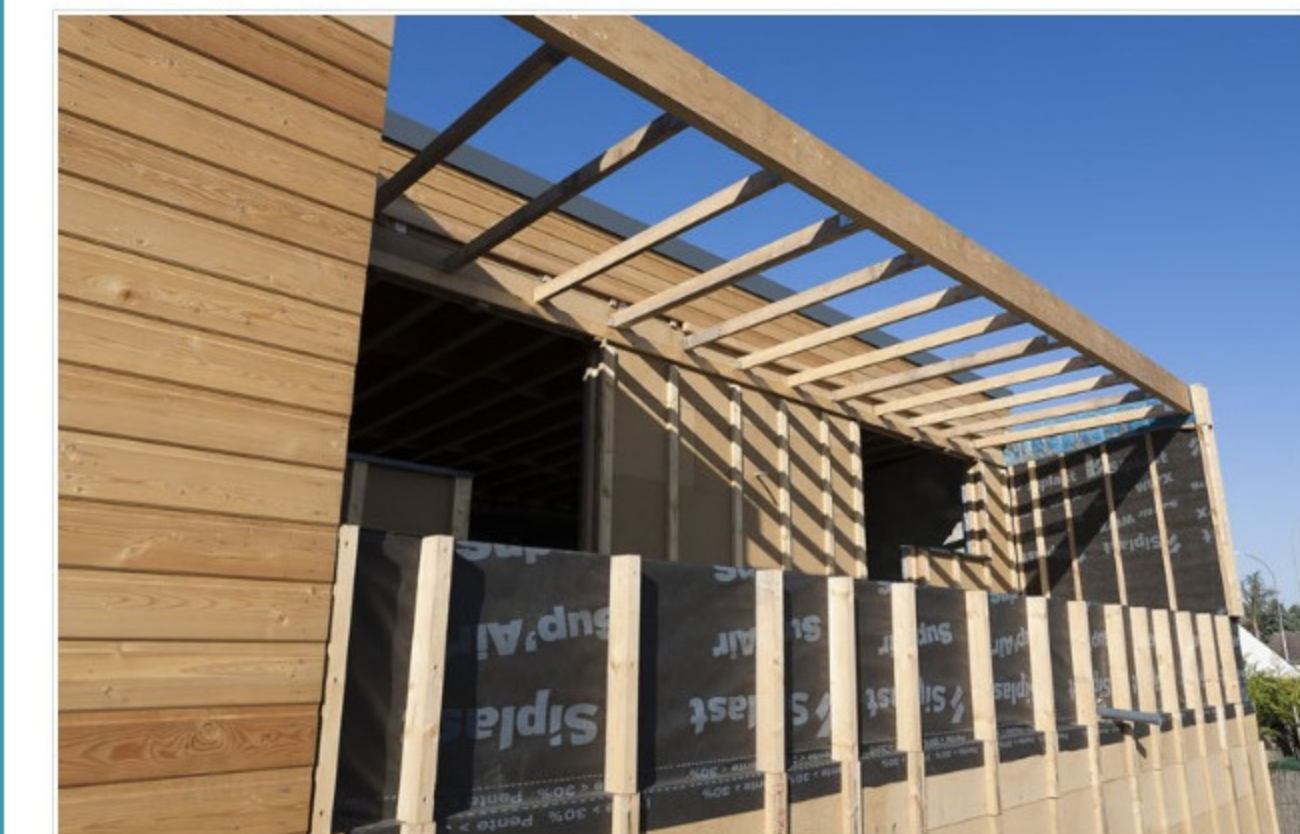
Chantier d'éco-construction de 10 maisons individuelles groupées sous formes de 3 bandes de 3, 4, et 3 logements mixtes bois -béton, isolation fibre de bois.

Précisons un point dérangeant dans la récente popularité des « éco-quartiers ». Réaliser un projet « admirable » dans un contexte de médiocrité urbanistique ne devrait pas être considéré comme une démarche de développement urbain durable et éco-responsable. L'objectif devrait être – pour tous les acteurs de la ville – de faire des quartiers de qualité, partout. Sans rechercher le projet qui nous mettrait sous les feux de la rampe.