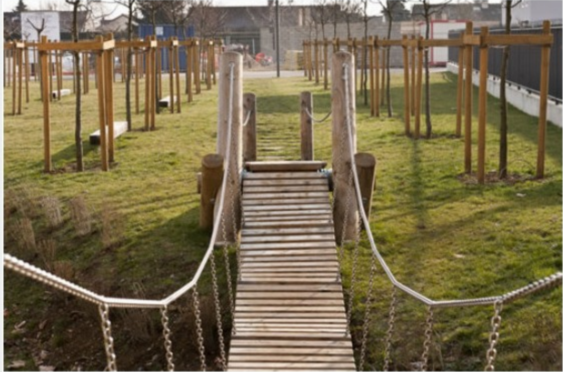
Jeux pour enfants en bois, au coeur de l'éco-quartier "les Rives de Bourg Bief" de Longvic. Ces jeux font la liaison entre le quartier (social) existant et les nouvelles constructions.

En tant qu'acteur de l'éco-habitat, notre réflexion porte davantage sur le bâti.